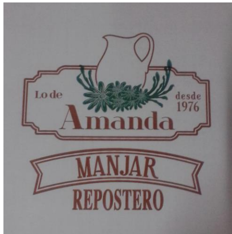
FORMATO DE 10 KILOS